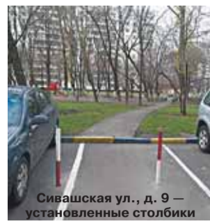
Сивашская ул., д. 9 — установленные столбики

Ответ. Турник на вышеуказанной площадке отремонтирован.