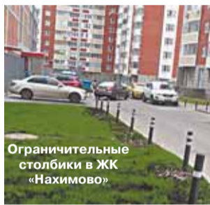
Ограничительные столбики в ЖК «Нахимово»

Ответ. Ограничительные столбики установлены.