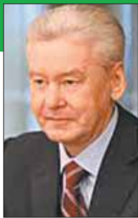
Сергей СОБЯНИН, мэр г. Москвы

Недавно принят новый Федеральный закон об образовании и новые школьные образовательные стандарты, введена новая система финансирования школ, новая система оплаты труда преподавателей. Сегодня с уверенностью можно сказать, что московская система образования остается самой лучшей в Российской Федерации. За последние годы резко выросло количество будущих школьников, нынешних воспитанники детсадов. Никогда в Москве не было такой динамики количества детишек, которые получают дошкольное образование. Не последнюю роль в этом сыграло то, что город за это время построил более сотни детских дошкольных учреждений. Сегодня проблема очередности в детские сады в городе практически решена: