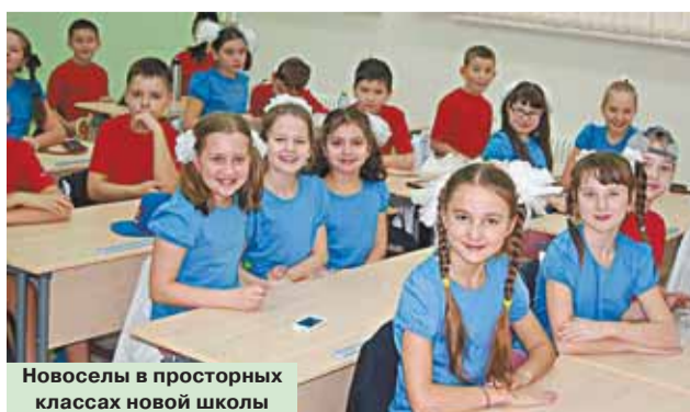
Новоселы в просторных классах новой школы